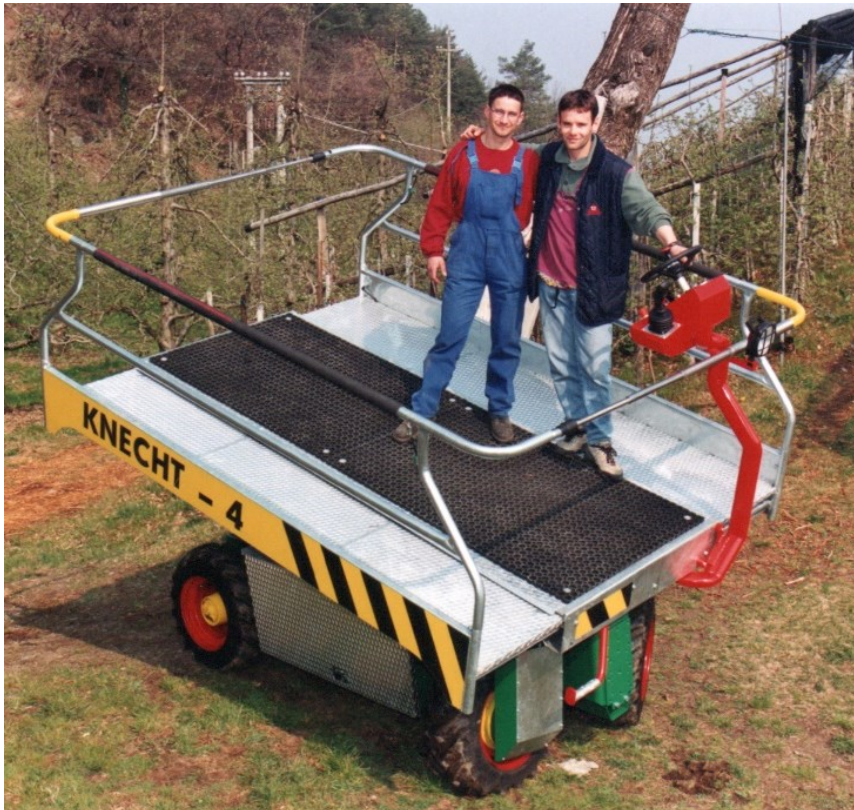
Erster „Knecht 4“ – Hebebühne für den Obstbau Frühjahr 1998 (Schenkung Firma BerMar-Tec, Lana)