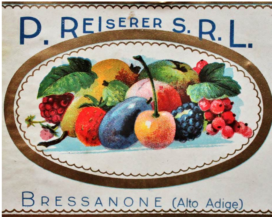
Etikette der Saft- und Marmeladenfabrik Reiserer, Brixen.