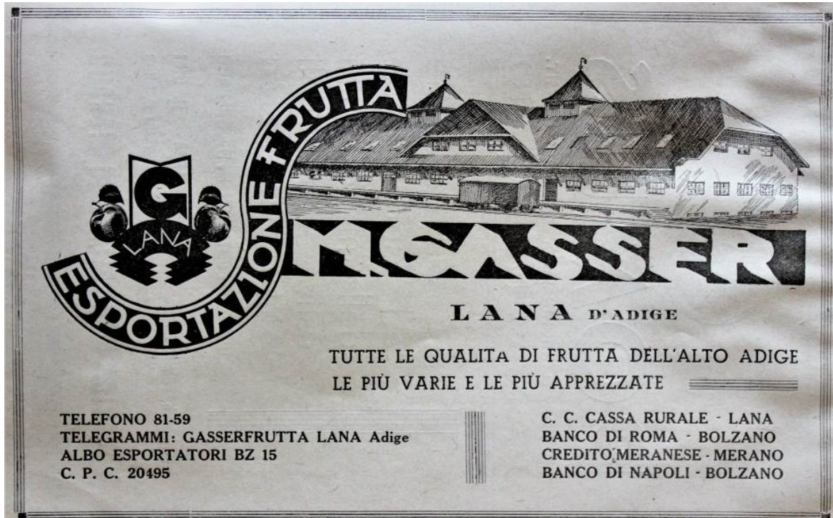
Werbeinserat in S. A. Bevilaqua Lombarini (Hrsg.): Annuario commercio ortofrutticolo d'Italia, 1941-42 (Bibliothek O 264/ Geschenk Christine Lezuo Steiner, Lana)